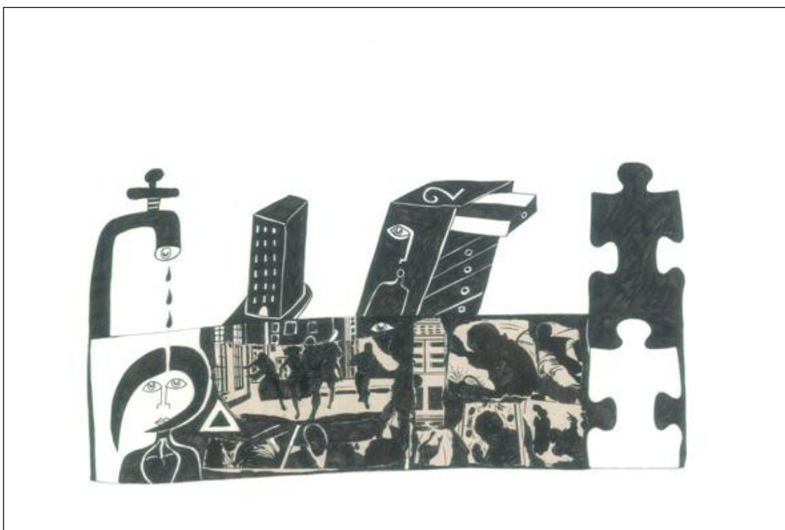
Marcel Miracle, dessin collage, 30 x 40cm