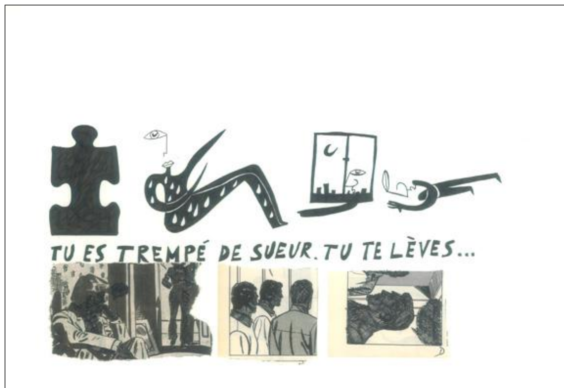
Marcel Miracle, dessin collage, 30 x 40cm, 2011