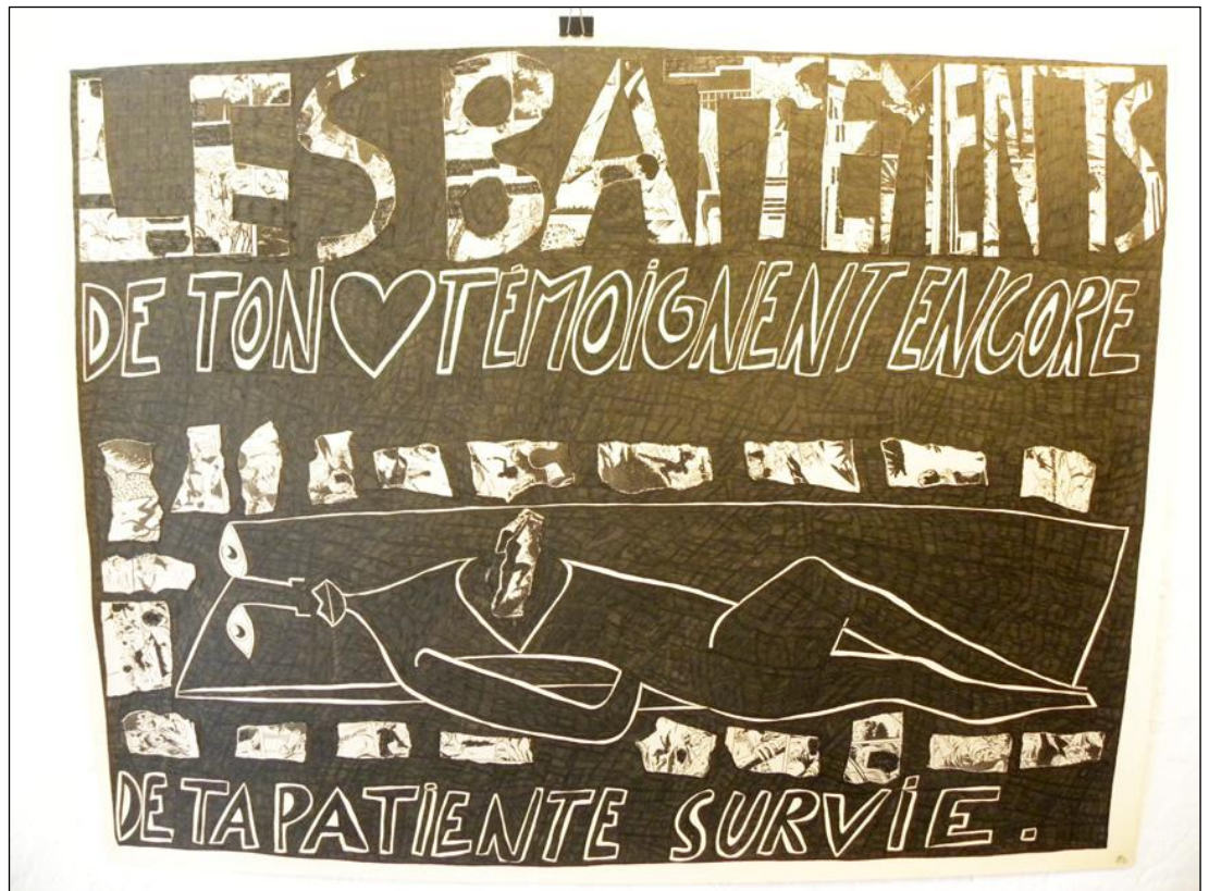
Marcel Miracle, dessin collage, 50 x 65 cm, 2012

Contact presse: Véronique Philippe-Gache Galerie LIGNETreize