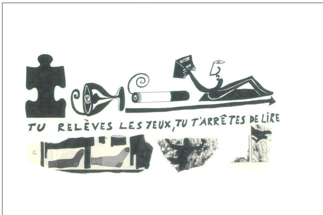
Marcel Miracle, dessin collage, 30 x 40cm, 2011