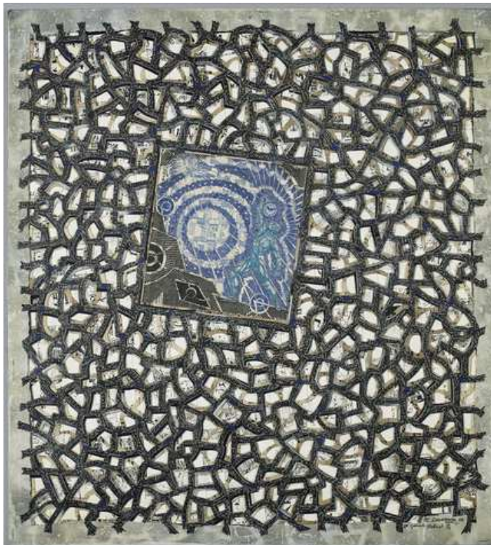
Rehaut 2/2009, 55 x 45 cm