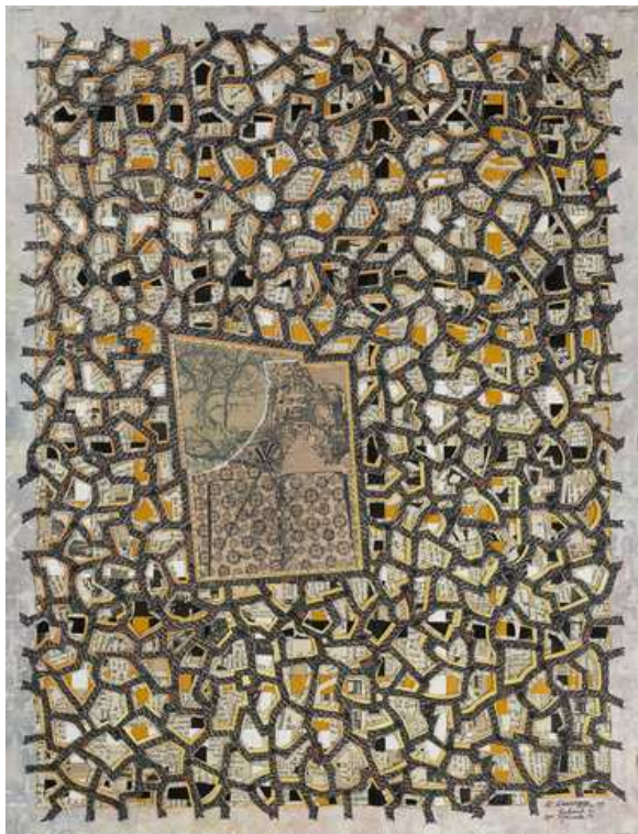
Rehaut 13/2009, 55 x 45 cm