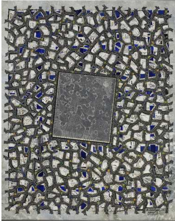
Rehaut 12/2009, 60 x 45 cm