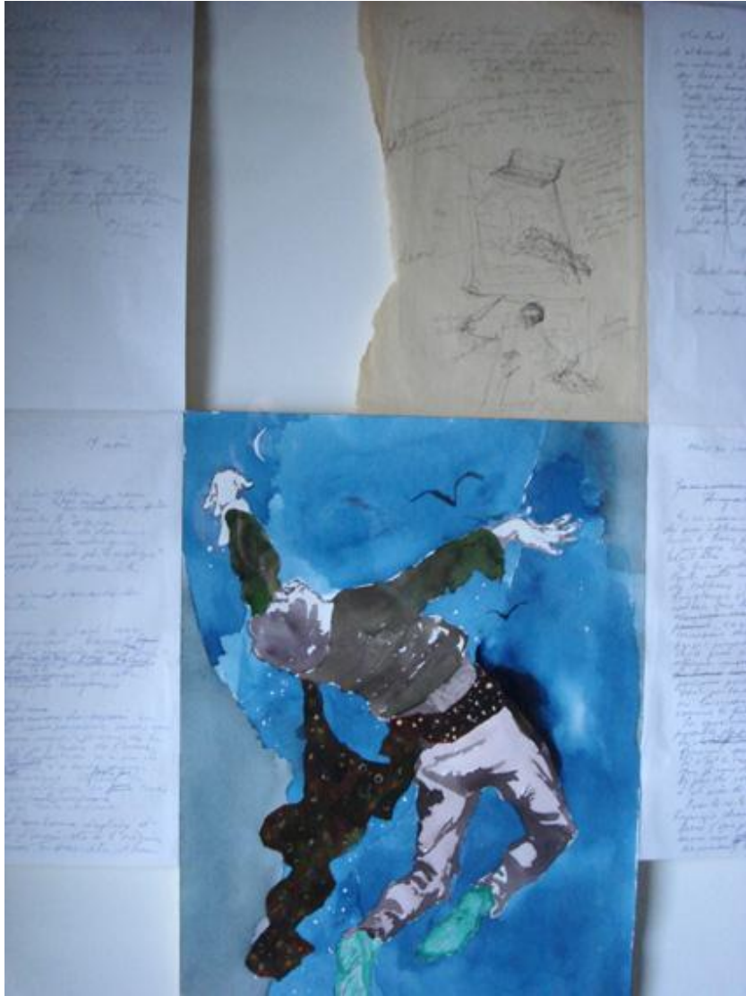
Jean Le Gac la vie aqurellée, 1993, aquarelle et manuscrit.