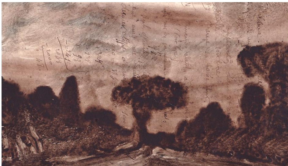
Paysage 2012, technique mixte sur papier, 14 x 21 cm