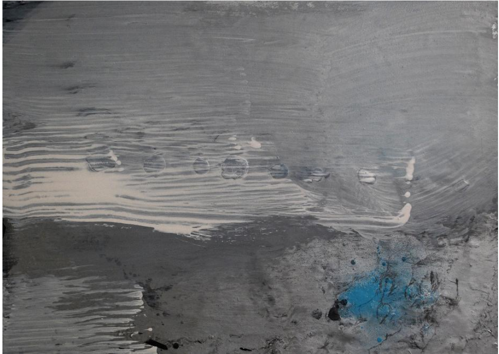
Olivier Saudan, Borgarnes8, 2010, Laque et crayon sur papier marouflé sur aluminium, 50x70 cm