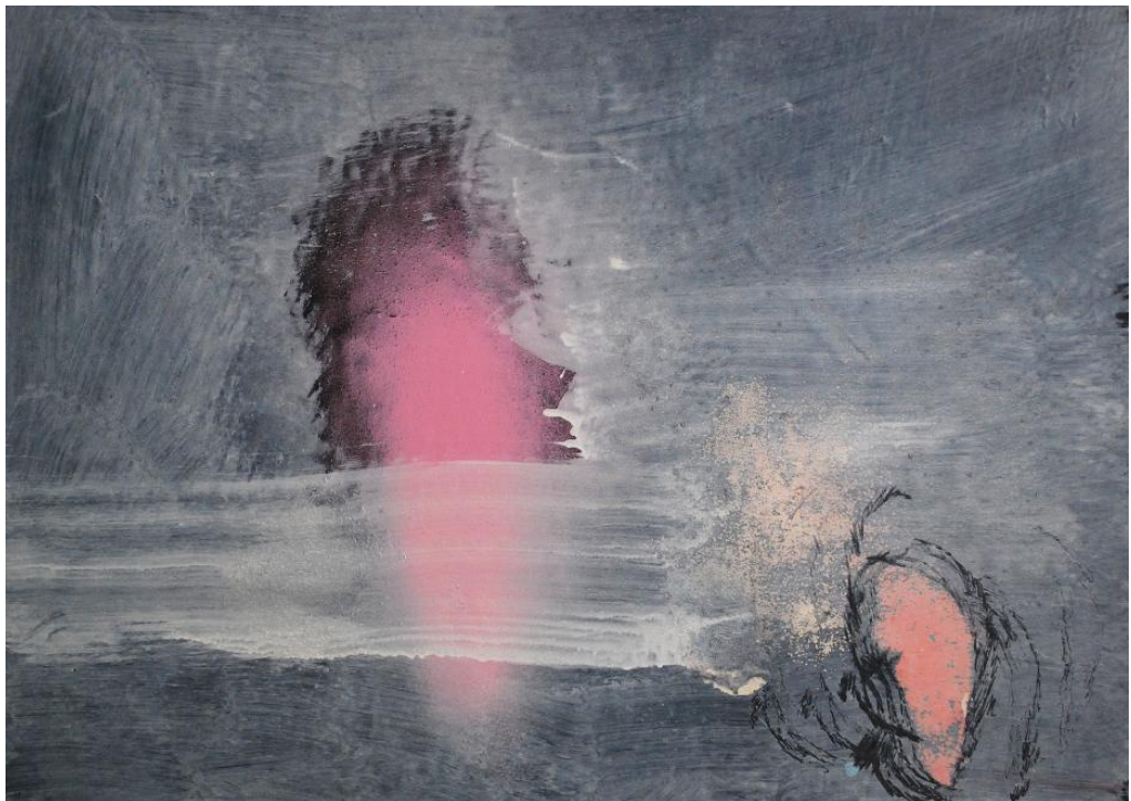
Olivier Saudan, Borgarnes6, 2010, Laque et crayon sur papier marouflé sur aluminium, 50x70 cm