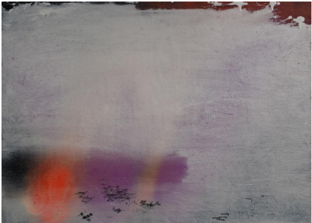
Olivier Saudan, Borgarnes1, 2010, Laque et crayon sur papier marouflé sur aluminium, 50x70 cm