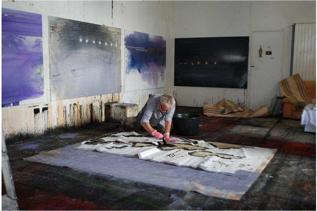
L'atelier, octobre 2010