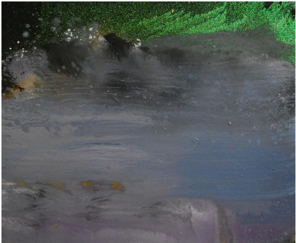
Olivier Saudan Bifrost2, 2010, Huile, laque et diamantine sur toile, 100x120 cm